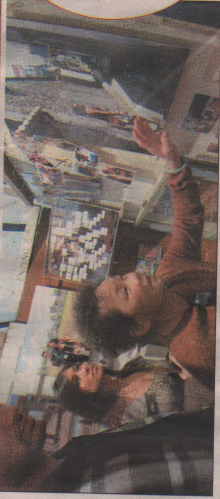
2009至2010年度「尋根之旅」展覽會剪綵儀式(上圖)；左圖為長者看到「尋根之旅」展覽，想起昔日家鄉巷里。